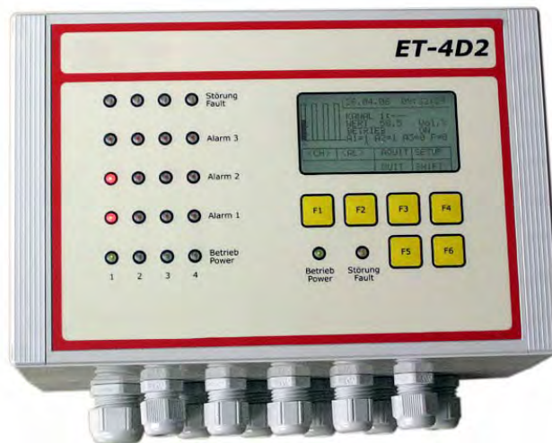
(Das Foto zeigt die Version im Wandaufbauegehäuse)

Beschreibung : Gaswarnzentrale zur Messung brennbarer und/oder toxischer Gase sowie Sauerstoff. Rauchmelder-Option. Grafikdisplay. 3 Alarmschwellen pro Kanal. 12 frei konfigurierbare Relais.